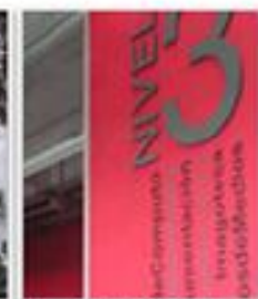
Universidad de Caldas