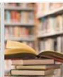
Programas de postgrado