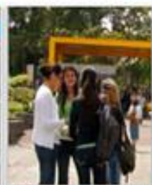
Programas de pregrado